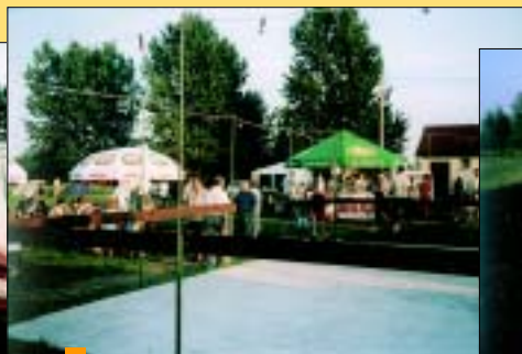
Zysk z festynu przeznaczony będzie na doposażenie placówki.