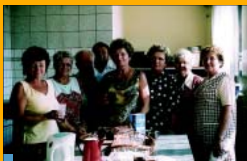
Członkinie tuskiego Koła dbały o dział kulinarny.