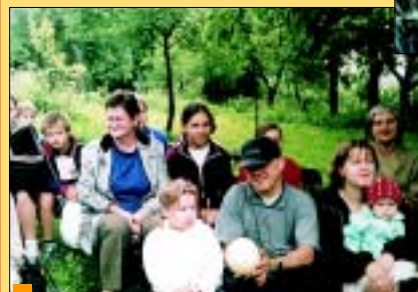
W hodowli strusi.