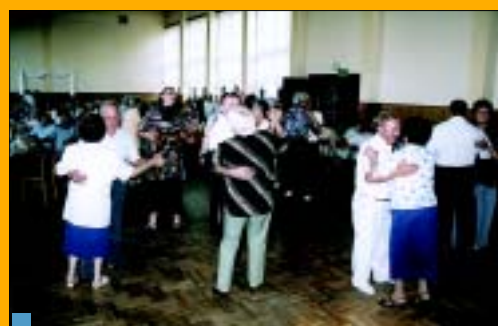
Do tańca nie trzeba było zapraszać.