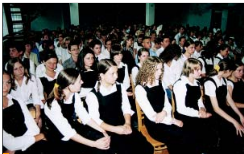
Prymusi na sali czyżowickiego WDK.