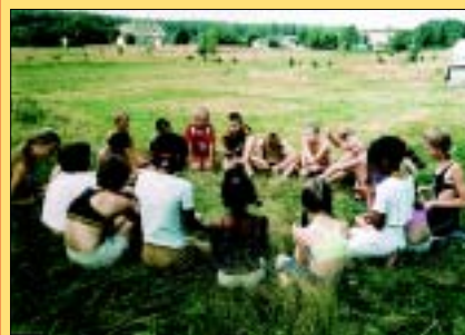
Poznajmy się, przed nami wakacje w Bierach!