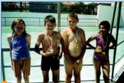
I Turniej Pływacki i jego laureaci.