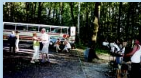
Pielgrzymom zapewniono dobrą oprawę muzyczną, co zachęciło do wspólnych tańców.