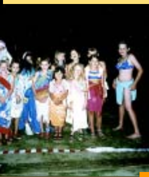
„Pokaz mody ręcznikowej.”