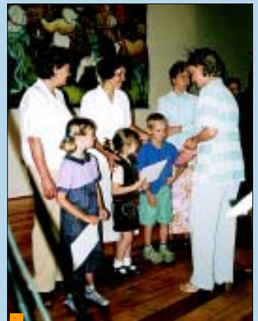
Po raz pierwszy nagrodzeni przedszkolacy.