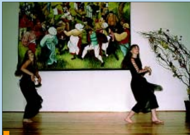
Przepiękny taniec wykonały uczennice Gimnazjum w Turzy Śl.