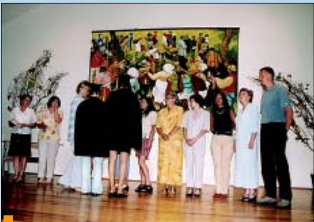
Podziękowania dla nauczycieli.