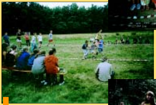
Instruktorzy WDK Gorzyce dbali by czas był wypełniony atrakcyjnymi zajęciami co do minuty.