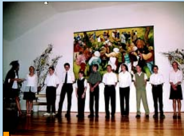
Wyróżnieni przedstawiciele gimnazjalistów.