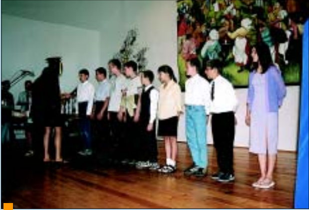
Uczniowie szkół podstawowych.