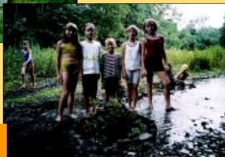
Jedna z grup „budowania zamków kamiennych w wodzie”.