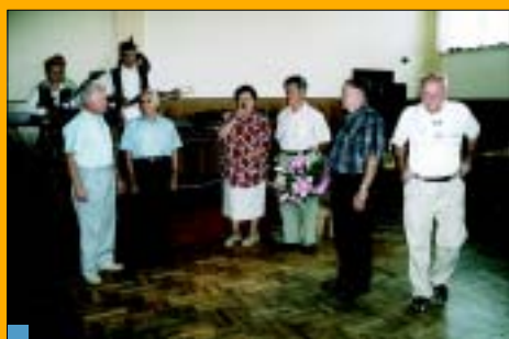
U honorowanie prezesów Kół.