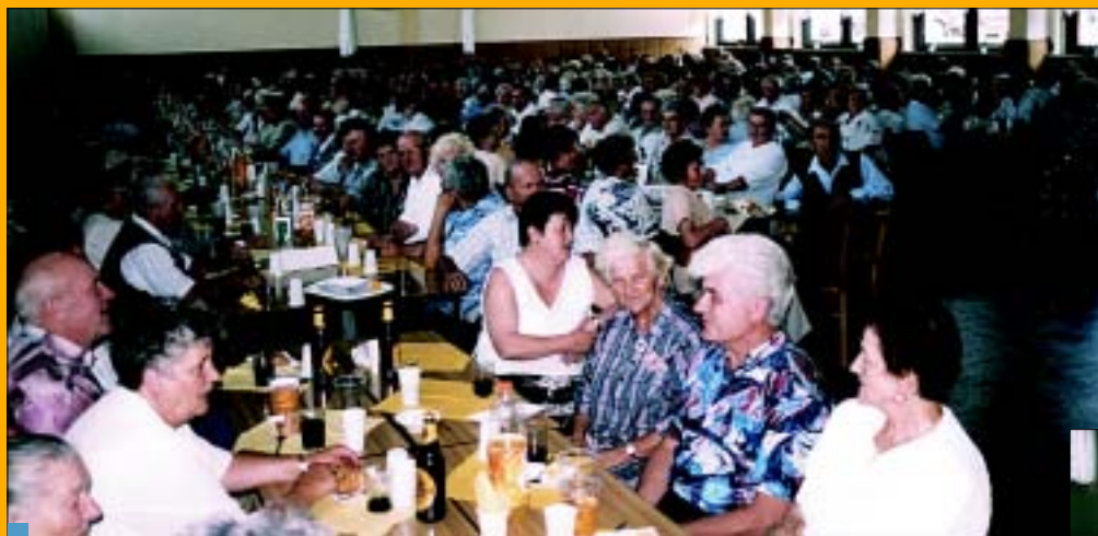
W turskiej sali zebrano się 400 członków Kół z terenu Gminy Gorzyce.