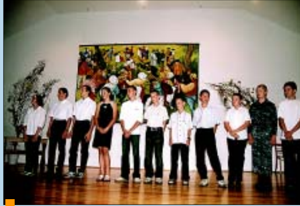
Uczniowie szkół podstawowych.