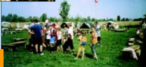
Na Polu Biwakowym w Olzie.