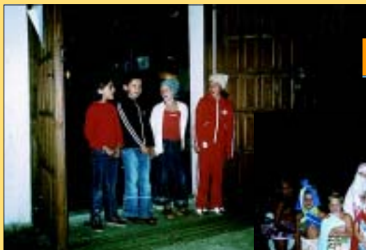
„Idol – Biery '2003”.