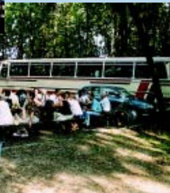
Pielgrzymi z Kopciowic każdego roku odwiedzają Osinian!