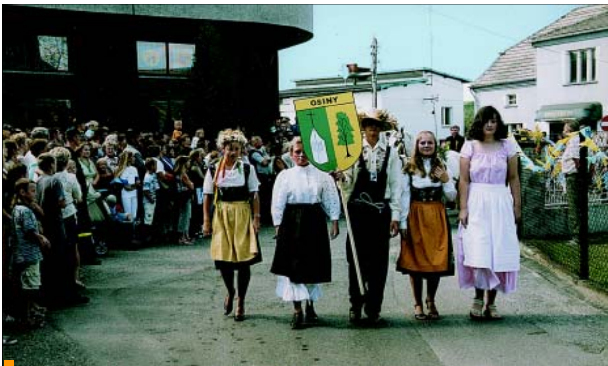
Korowód dożynkowy rozpoczęła osinska młodzież.

▶▶ C.d. na str. 3 i 10 ▶▶ Fotoreportaż na załączonej wkładce