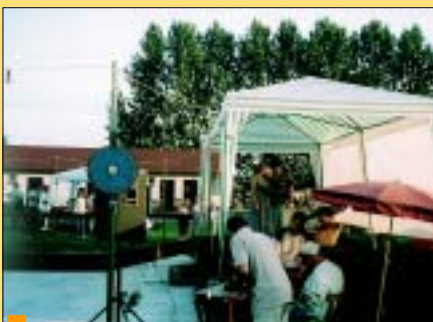
Festyn zorganizowały pracownice „Caritas” Archidiecezji Katowickiej w Gorzycach.