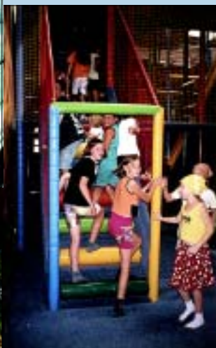
W „Fikolandii”.