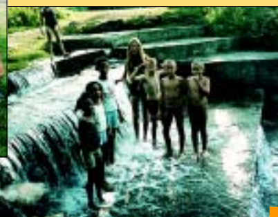
Kąpiel w rzece w Bierach.