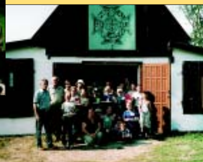
Przed stołówką na naszym obozowisku.