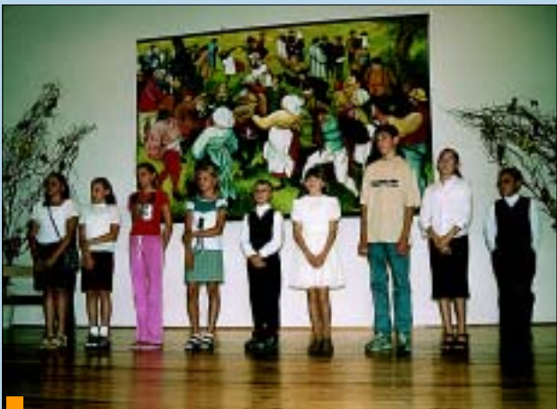
Uczniowie szkół podstawowych.