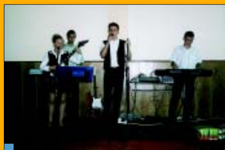
Do tańca grał zespół „Singiel”.