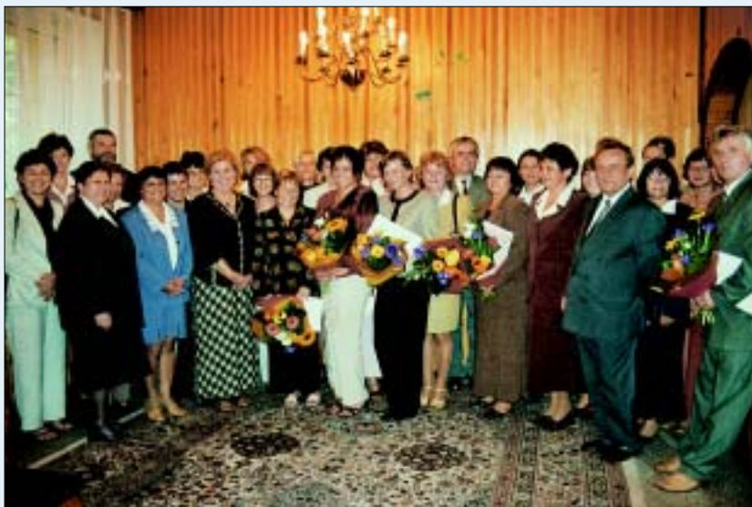
Uczestnicy spotkania w gorzyckim USC.

Być mistrzem... to cel trudny, ale jak dowodzi praktyka – osiągalny dla wielu naszych pedagogów