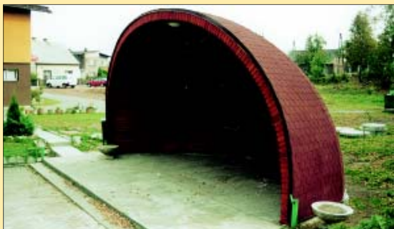
Nowa muszla koncertowa w Czyżowicach.