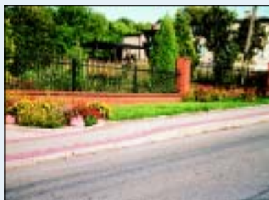
Jaki to styl?